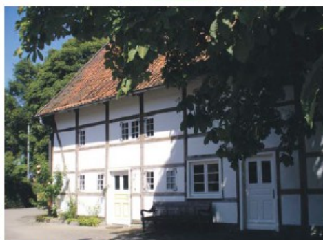
Schöner wohnen in ländlicher Mylie.